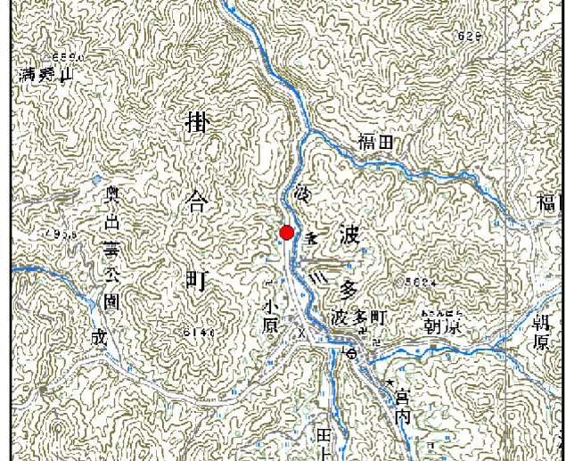
位置図※ 縮尺: 1/50,000