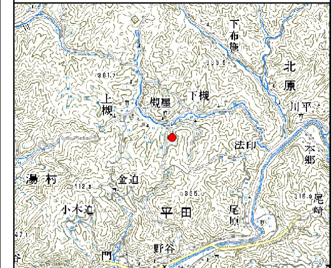
位置図※ 縮尺: 1/50,000