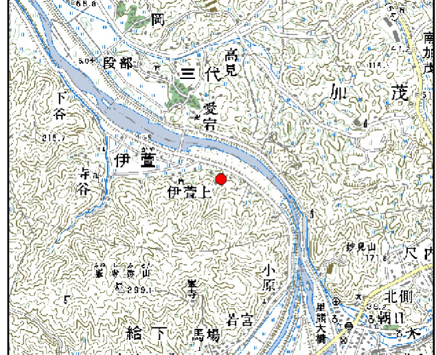
位置図※ 縮尺: 1/50,000