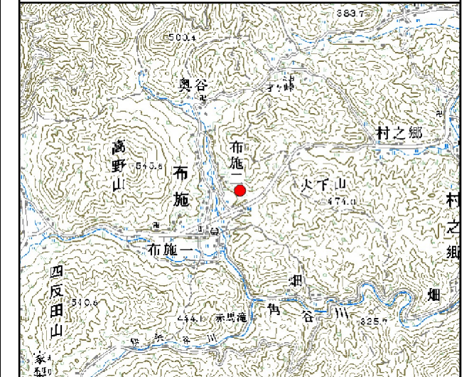
位置図※ 縮尺: 1/50,000