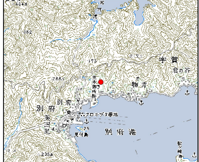
位置図※ 縮尺: 1/50,000